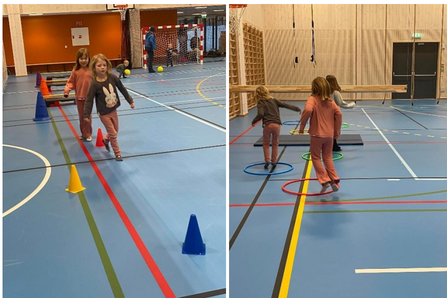
Bildene er fra allidrett i ny hall februar 2022.

Arbeidet med å dra i gang allidrett i januar 2022 har blitt gjort av medlemmer i hovedstyret.